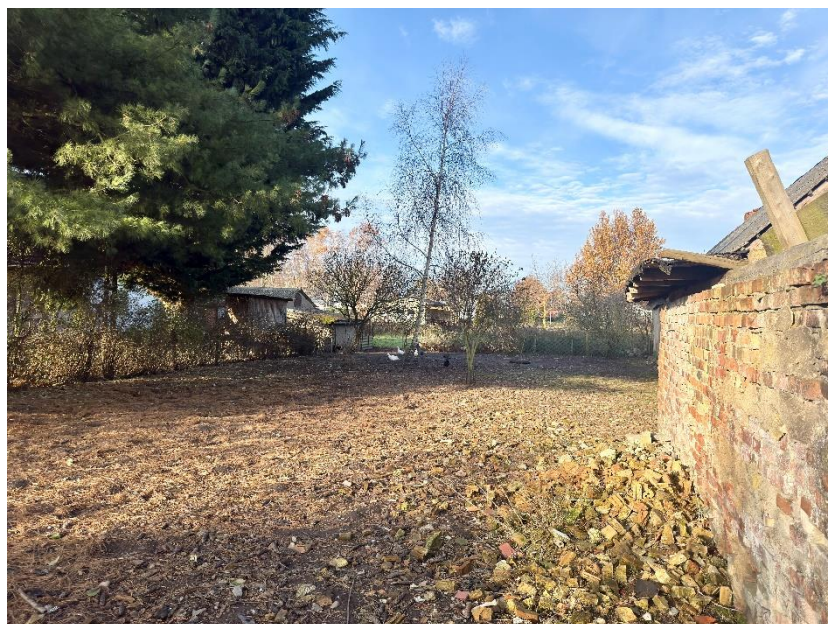
Blick in den Hinterhof