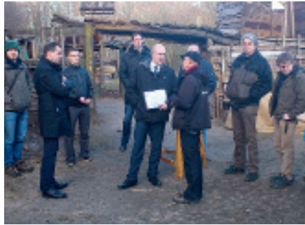
Der Energieminister des Landes, Christian Pegel, übergibt den Fördermittelbescheid an den Verein.

Die Kinder und Betreiber des Bauspielplatzes Schwerin e.V. hatten Ende Februar prominenten Besuch und Anlass zur Freude: Christian Pegel, neuer Energieminister des Landes M-V, übergab dem Verein einen Förderbescheid über fast 17.000 Euro aus dem »Aktionsplan Klimaschutz«. Die bewilligten Mittel sollen zur energetischen Erneuerung der Heizungsanlage für die Gebäude auf dem Bauspielplatzgelände eingesetzt werden. Bei einer Gesamtinvestition in Höhe von ca. 34.000 Euro bringt der Verein die Hälfte als Eigenanteil auf.