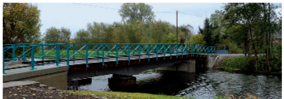
Die Brücke über den Bützow-Güstrow-Kanal bei Zepelin wurde im Rahmen eines Flurbereinigerungsverfahrens erneuert.