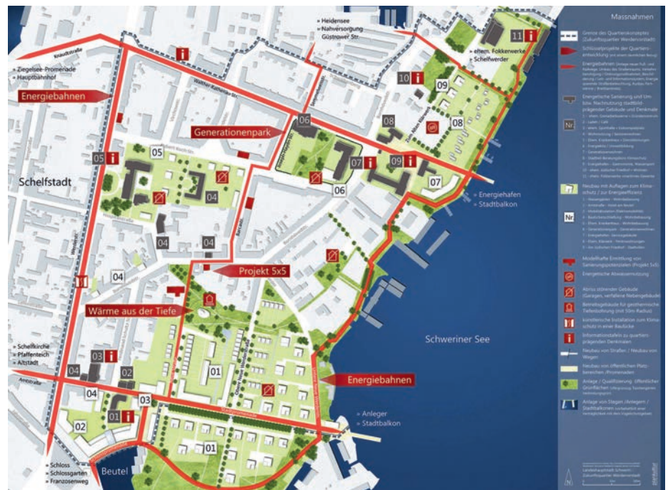
Maßnahmenkonzept für die Werdervorstadt

ges beauftragte die EGS in Abstimmung mit der Landeshauptstadt das Büro Plankultur. Das Entwicklungskonzept für die Werdervorstadt zeichnet sich vor allem durch ein Zusammenspiel von öffentlichem und privatem Engagement, von historischer und neuer Bebauung sowie von gebäude- und quartiersbezogenen Maßnahmen aus. Ideenreiche Schlüsselprojekte wie Wärme aus der Tiefe, ein Generationenpark sowie die Öffnung der Uferkante durch Rad- und Fußweg als »Energiebahn« sind in die städtebauliche Entwicklung eingebunden. Mit einem »Klimapakt« wird umweltfreundliches Handeln von den Bürgern und Eigentümern durch freiwillige Selbstverpflichtun-