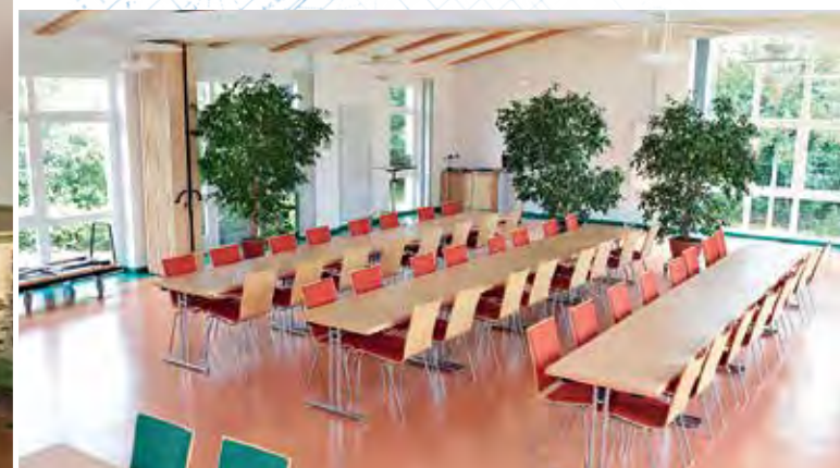
In das Verwaltungsgebäude von Woldegk wurde ein moderner Tagungs- und Präsentationsbereich integriert.