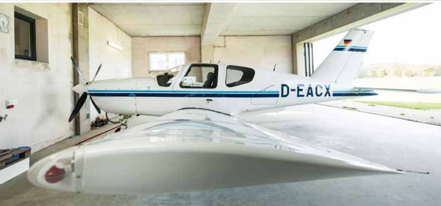
Individuell konstruiert: Auf Wunsch des Bauherren wurde der Hangar entsprechend der Spannweite des Flugzeugtyps geplant und gebaut.