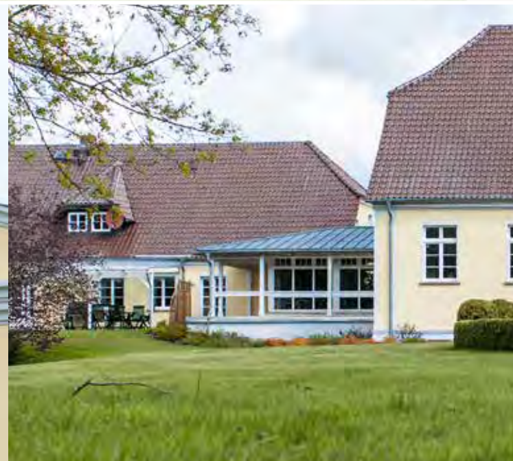
Neuer Verbinder zwischen Gutshaus und Wirtschaftsgebäude