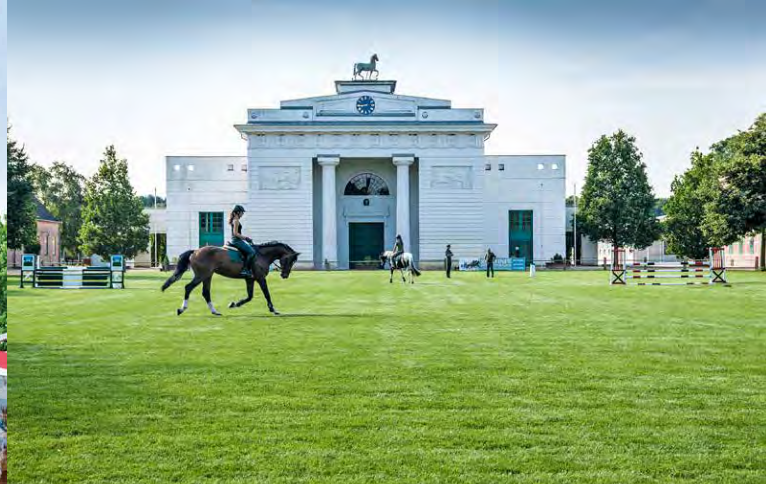
Behutsame Sanierung des klassizistischen Reithallenportals. In der angrenzenden Reithalle finden heute Konzerte, Ausstellungen und Turniere ein würdiges Ambiente.