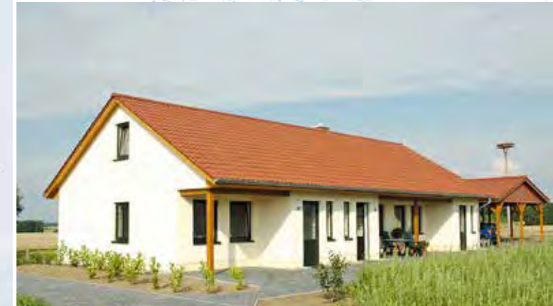
Moderner Neubau: Ferienhaus mit großartiger Aussicht in die umgebende Landschaft in Alt-Schöнау, nördlich von Waren (Müritz)