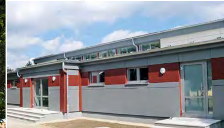
Multifunktionshalle in Kritzkow: Umbau der ehemaligen Sporthalle zu einem modernen Multifunktionszentrum für Sport, Veranstaltungen und Vereine