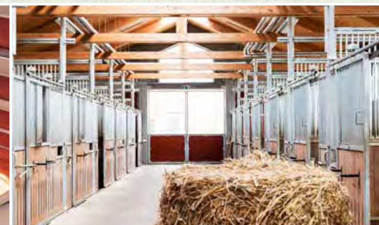
Modern, hell und großzügig sind die neuen Ställe der mecklenburgischen Pferdezucht.