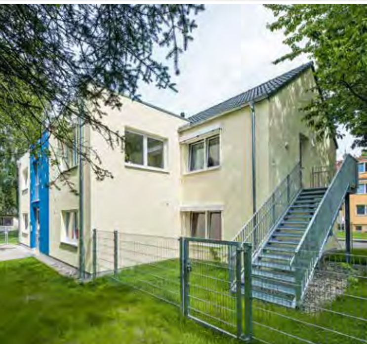
Zweiter Rettungsweg mit Abtrennung von der Außenspielfläche