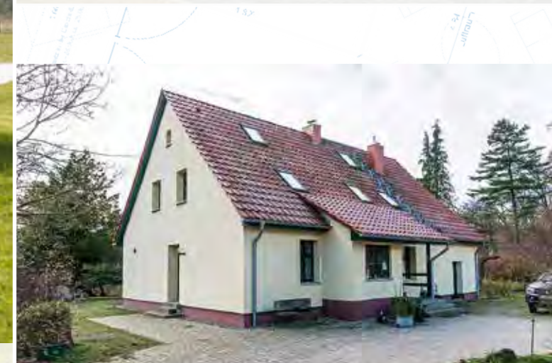
Revierförsterei Kronwald: komplette Modernisierung des über 100 Jahre alten Hauses im vorpommerschen Loitz-Rustow