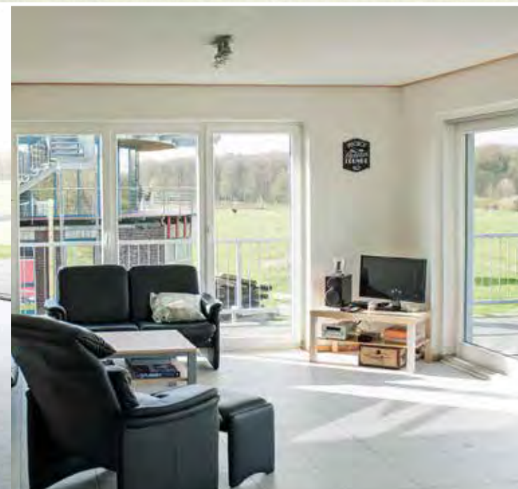
Der offene Wohnbereich mit Blick auf Flugfeld und Salzhaff