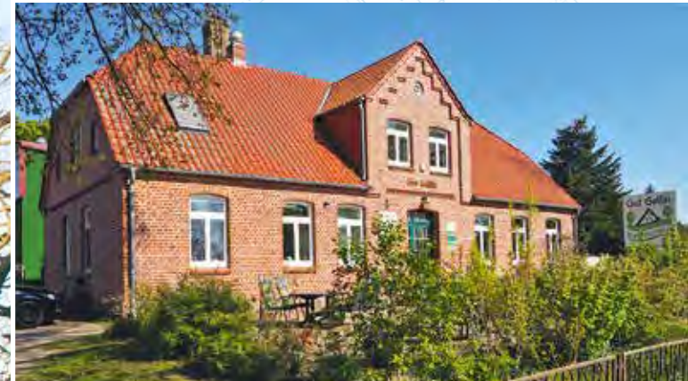
Gut Gallin: Sanierung eines früheren Wohngebäudes, in dem sich heute Büroräume, der Hofladen und die »Bauernstube« befinden