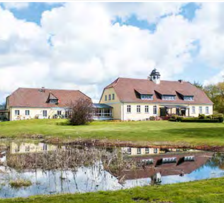
Schlicht und schön erstrahlt die hell verputzte Fassade des Ensembles.