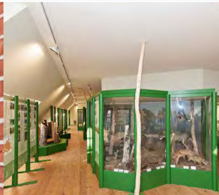
Forst- und Holzmuseum: Im Obergeschoss befindet sich auf ca. 300 m 2 eine sehenswerte Ausstellung zu den Themen Wald, Forst, Holz und Natur.