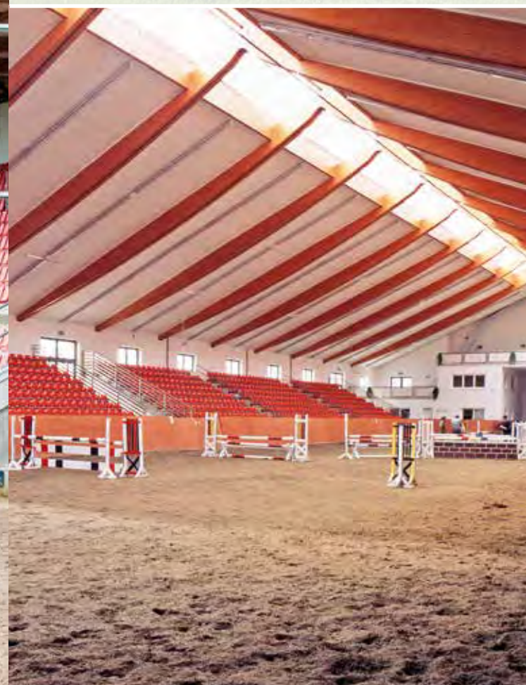
Neu errichtet: die moderne Reithalle des Landgestüts