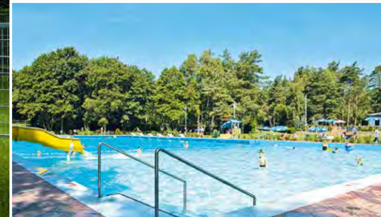
Waldbad in der Gemeinde Vellahn: Erneuerung des Schwimmbeckens inklusive Beckenkopfsanierung und Beckenauskleidung im beliebten Freibad in Südwestmecklenburg