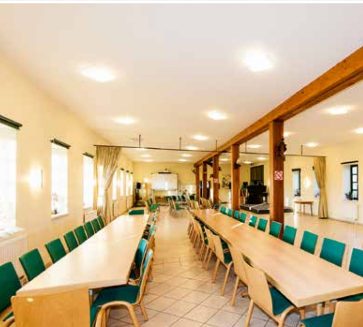
Blick ins Innere: großzügiger Schulungs- und Tagungsbereich im Erdgeschoss des Gebäudes