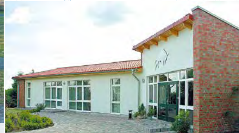
Neubau eines modernen Verwaltungsgebäudes für die Geschäftsstelle Woldegk der Rinder Allianz GmbH