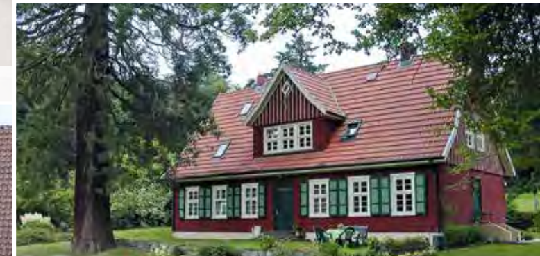
Revierförsterei Lübzin-Rosenow: Nach historischem Vorbild wurden Dach, Fenster und Türen des schmucken Forsthauses im Warnow Durchbruchstal erneuert.