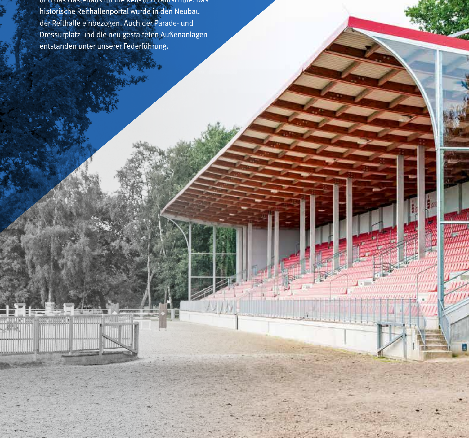
Eine neue Tribüne mit 3.000 Sitzplätzen für sportliche und touristische Veranstaltungen wurde errichtet.

Im Auftrag des Landes Mecklenburg-Vorpommern planten wir die Restaurierung großer Teile der landesherrschaftlichen Gestütsanlage, die auch um neue Attraktionen bereichert wurde. Darunter zwei stattliche Stallgebäude sowie einige Fachwerkhäuser und das Gästehaus für die Reit- und Fahrschule. Das historische Reithallenportal wurde in den Neubau der Reithalle einbezogen. Auch der Parade- und Dressurplatz und die neu gestalteten Außenanlagen entstanden unter unserer Federführung.