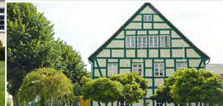
Fachwerkhaus in Altentreptow: vollständige Sanierung des denkmalgeschützten Wohn- und Geschäftshauses