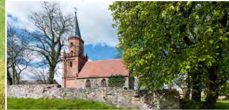
Kirche Plath: Sanierung des »Buddelturmes« und des Ostgiebels sowie Installation einer Blitzschutzanlage für die gotische Feldsteinkirche