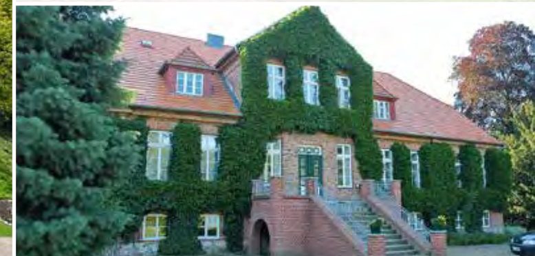
Forstamt Jasnitz: Sanierung von Fassade, Dach und der imposanten Treppe des in Südwestmecklenburg gelegenen Forsthauses