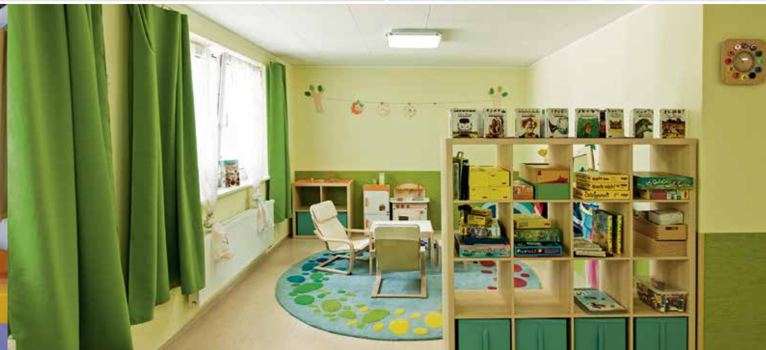
Hell und freundlich: die neu gestalteten Gruppenräume