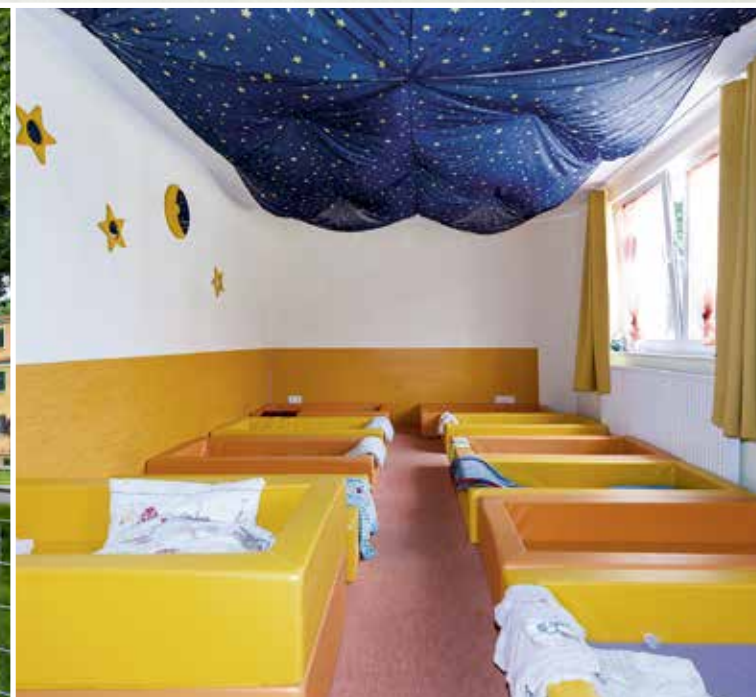
Ruhiger Schlafbereich unterm »Sternenhimmel«