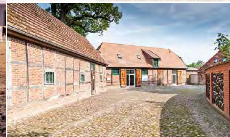
Teil des einzigartigen Ensembles: das Café »Kutschstall«