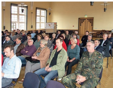
Die Bürger brachten ihre Ideen ein.