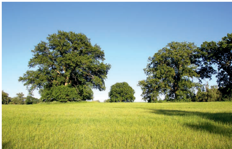
Am Breeser See entwickelte die Landgesellschaft ein Ökokonto für Ausgleichsmaßnahmen.