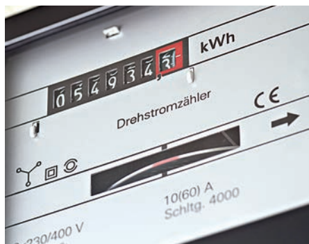
Beim Energieaudit werden alle Energieflüsse systematisch erfasst und analysiert.

Nach dem Energiedienstleistungsgesetz (EDL-G) besteht für Unternehmen, die gemäß EU-Definition kein kleines oder mittleres Unternehmen (KMU) sind, die Verpflichtung, bis zum 5. Dezember 2015 ein Energieaudit durchzuführen. Das betrifft auch öffentliche Unternehmen und Einrichtungen. Die Landgesellschaft verfügt über das Know-how sowie registrierte Auditoren zur Durchführung des Energieaudits. Darüber hinaus werden auch die Einführung eines Energiemanagementsystems nach DIN EN ISO 14001/ 50001 sowie Leistungen der