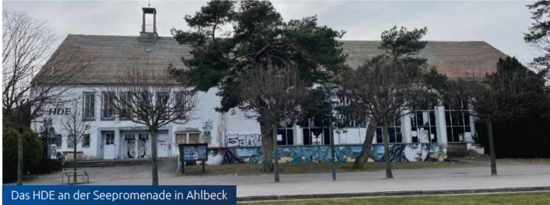
Das HDE an der Seepromenade in Ahlbeck

Verfahren vereint „Wettbewerb“, „Dialog“ und „Vergabe“